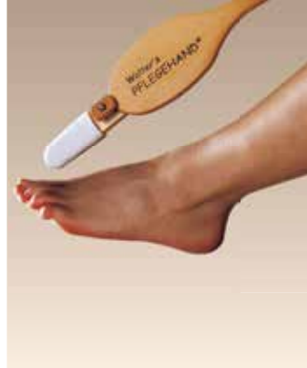
Ustensile pour nettoyer les orteils fixé au manche universel