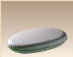
Coussinet pour étaler la crème N° d'article/PZN 051.6666