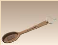
Manche universel N° d'article/PZN 1509556 (42 cm l) N° d'article/PZN 2461248 (57 cm l)