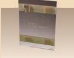
Fixation murale N° d'article/PZN 41.40904