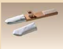
Ustensile pour nettoyer les pieds et les orteils N° d'article/PZN 1839578