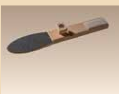
Lime contre la callosité N° d'article/PZN 2461277