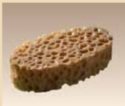
Eponge de soin N° d'article/PZN 051.6689