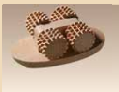
Rouleau de massage N° d'article/PZN 1839561