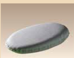
Coussinet un peu plus élevé d'un côté pour étaler la crème N° d'article/PZN 1839555