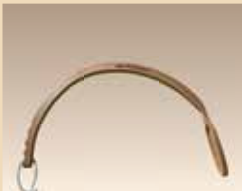
Manche courbé universel N° d'article/PZN 2461260