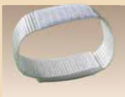
Système de fixation N° d'article/PZN 1839609