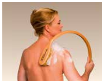
Utilisation d'un manche courbé