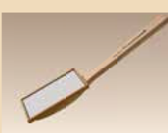
Miroir N° d'article/PZN 4120310