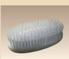
Brosse de soin N° d'article/PZN 051.6672