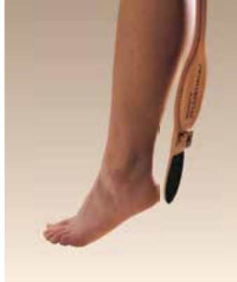
Lime contre la collosité fixé au manche universel