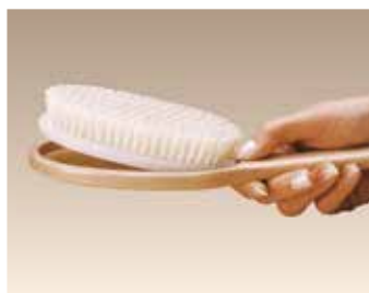
Changement aisé de la brosse