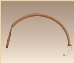
Universalstiel Bogenform Art. Nr./PZN 2461260