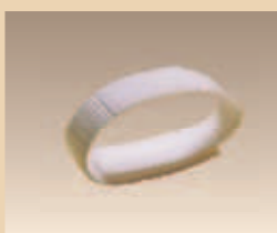
Halteband Art. Nr./PZN 1839609