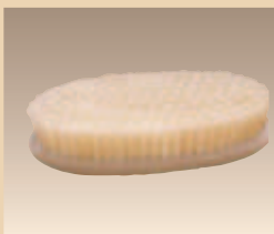
Pflegebürste Art. Nr./PZN 0516672