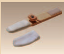
Fuß- /Zehenreiniger Art. Nr./PZN 1839578