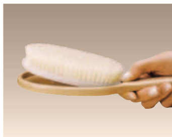
Einfaches Wechseln der Bürste