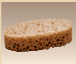
Pflegeschwamm Art. Nr./PZN 0516689