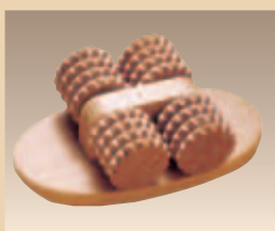
Massageroller Art. Nr./PZN 1839561