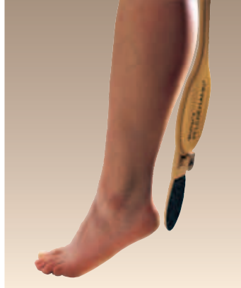
Hornhautfeile am Universalstiel