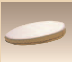
Eincremekissen Keilform Art. Nr./PZN 1839555