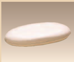
Eincremekissen Art. Nr./PZN 0516666