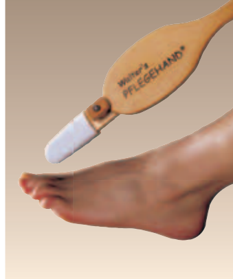
Fuß- /Zehenreiniger am Universalstiel