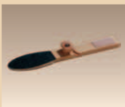
Hornhautfeile Art. Nr./PZN 2461277