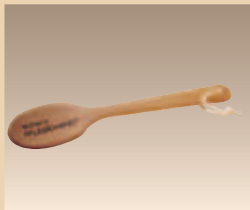
Universalstiel Art. Nr./PZN 1509556 (42 cm l) Art. Nr./PZN 2461248 (57 cm l)