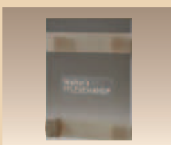
Wandhalterung Art. Nr./PZN 4140904